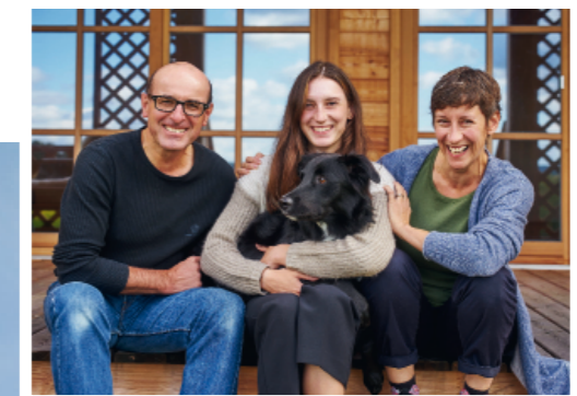
Zu einem baubiologisch tadellosen Haus wie diesem Domizil einer Schweizer Baufamilie (rechts) gehört auch eine baubiologisch einwandfreie Hausplanung.